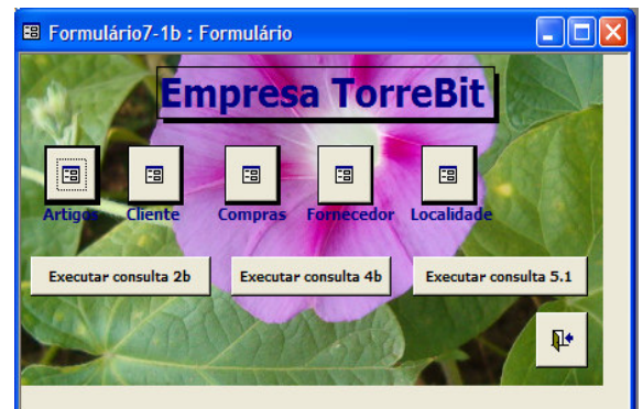
Imagem 1.2 – Exemplo final do formulário